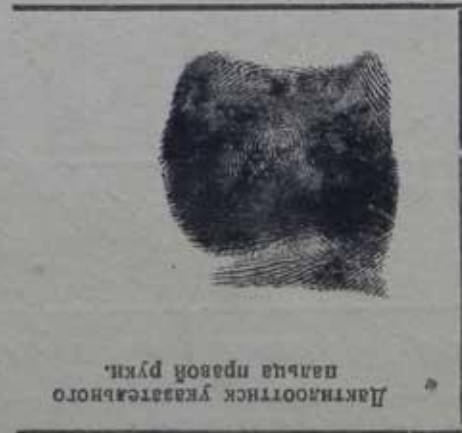
Лактимова указательного пальца правой руки.

ПРИМЕЧАНИЕ: Если некоторые вопросы анкетным путем не будут выяснены, о них проверяемый должен быть допрошен отдельно.