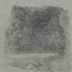
Лакриматографический указатель пальца правой руки

Примечание. Если некоторые вопросы анкетным путем не будут выяснены, о них проверяемый должен быть допрошен отдельно.