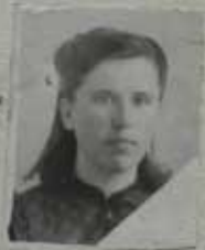
Место для фотокарточки