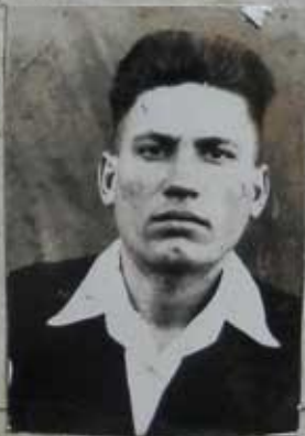
Место для фотокарточки

Примечание. Если некоторые вопросы анкетным путем не будут выяснены, о них проверяемый должен быть допрошен отдельно.