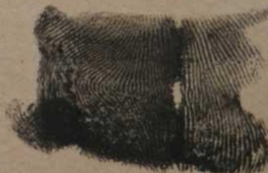
Дактилооттиск указатель- ного пальца правой руки

25 / 05 Почтовый адрес фильтра- ционного пункта 5 Село Д. Андросиевка Город Область Салтешкал Республ. УССР фильтрацию прошел с 19 г. по 19 г.