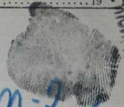
Дактилооттиск указательного пальца правой руки

фильтрацию прошел с 11. VII 1945 г. по 1945 г.