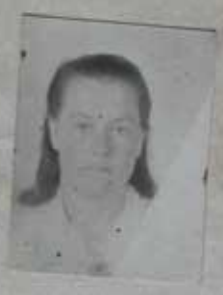
Место для фотокарточки